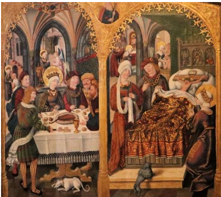
Bild: „Elisabethaltar in Marburg, um 1511“ | | CC-Lizenz BA-SY 4.0

Mi 20.11. 09:00 Uhr Elisabeth-Messe BIS HEUTE VORBILD: ELISABETH VON THÜRINGEN