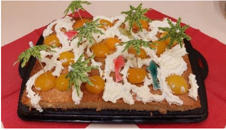
Passend zum Gastgeberland „Cookinseln“: ein Inselkuchen.

Gastfreundschaft, Gebete und Erfahrungen: Beim Weltgebetstag teilen Menschen rund um den Erdball solidarisch und auf Augenhöhe miteinander. Ein wichtiges Zeichen dieser Solidarität mit Frauen und Mädchen weltweit ist die Kollekte aus den Gottesdiensten.