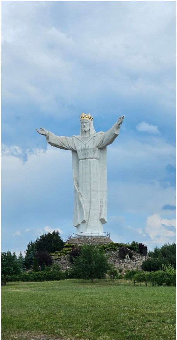
Die Christus-König-Statue. Schwiebus, Polen