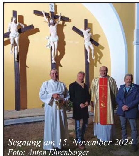
Segnung am 15. November 2024