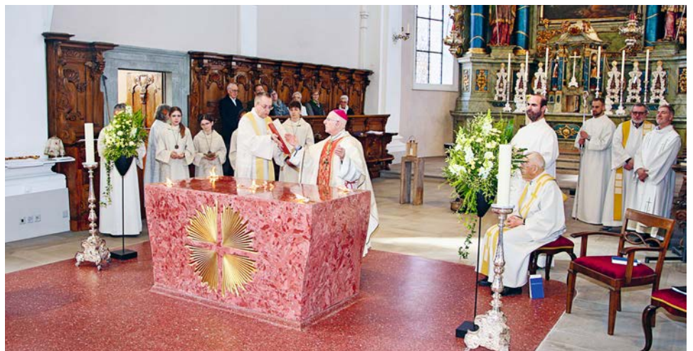
Der Weihrauch wird auf dem Altar verbrannt als Zeichen für das Heil, das Gott an den Menschen wirken will.