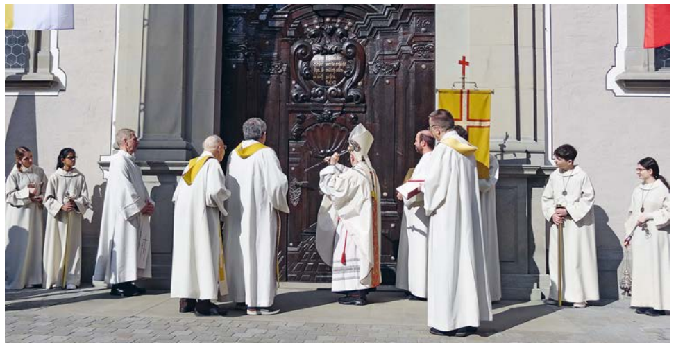
Eindrücklich die drei Schläge des Bischofs an das Portal: So spricht der Herr: Ich bin die Tür, wer durch mich hineingeht, wird gerettet werden.