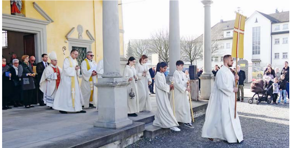
Auszug aus der Kapelle im Ried.

und dem Harmonie Musikverein Lachen, welche zu diesem unvergesslichen Tag beigetragen haben. Nachfolgend für alle, die nicht dabei waren, einzelne Impressionen.