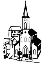
St. Wendelin Weisenbach