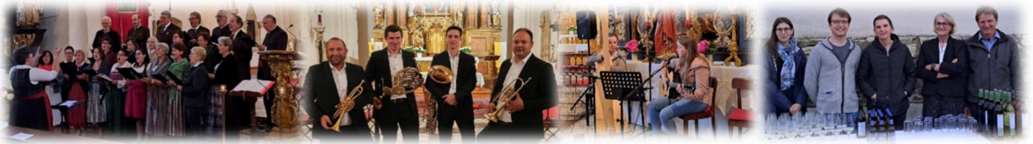
Lange Nacht der Kirchen in Bad St. Leonhard mit Benefizkonzert, Agape und Messweinverkostung