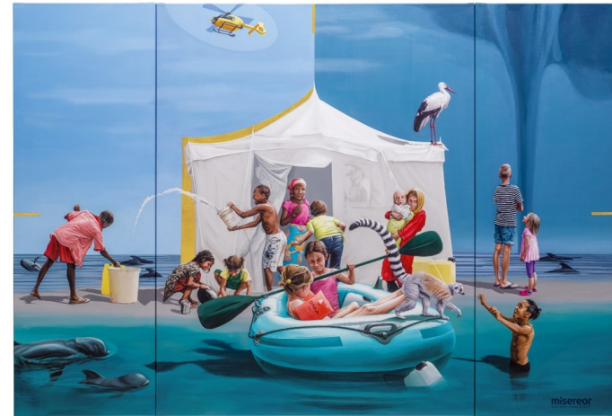
Das Misereor-Hungertuch 2025 "Gemeinsam träumen -Liebe sei Tat" von Konstanze Trommer

Gemeindebrief der kath. Gemeinde Liebfrauen