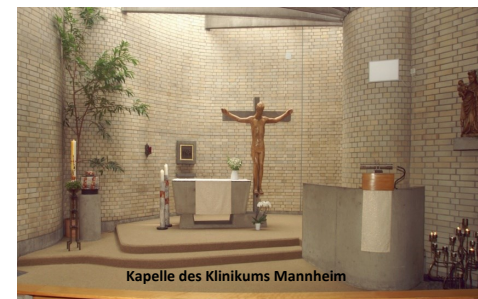
Kapelle des Klinikums Mannheim

In der Kapelle (Haus 7) des Klinikums finden regelmäßig Gottesdienste statt. Katholische Gottesdienste werden montags und freitags jeweils um 18.00 Uhr, sonntags um 10.30 Uhr gefeiert.