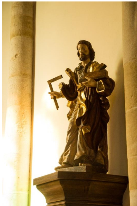
Jousefsstatu an der Nikloskierch zu Habscht

16:30 Bruch : Beichtgeleeënheet / Confessions.