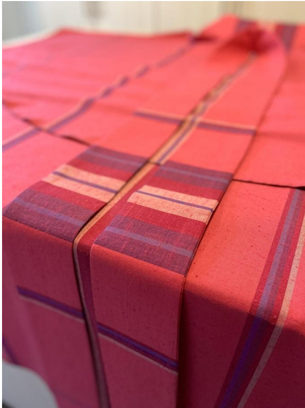
Rosa Massgewand fir Halleffaaschten

16:30 Bruch: Beichtgeleeënheet / Confessions.