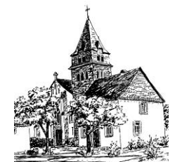
St. Cornelius und Cyprian Tellig