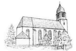
St. Peter und Paul Peterswald-Löffelscheid