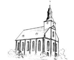
St. Philippus und Jakobus Mittelstrimmig