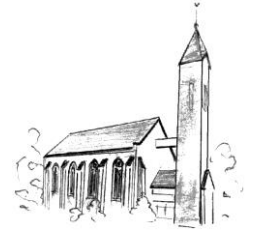
St. Matthias Grenderich