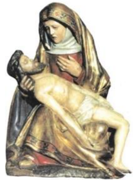
Gnadenbild Klausen - Mosel

Die Pfarrei Grenderich lädt im Namen der Pfarreiengemeinschaft herzlich zu dieser Wallfahrt ein.