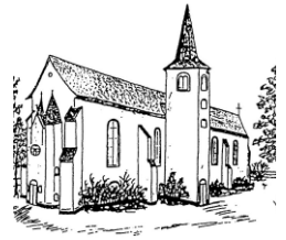
Maria Himmelfahrt Blankenrath