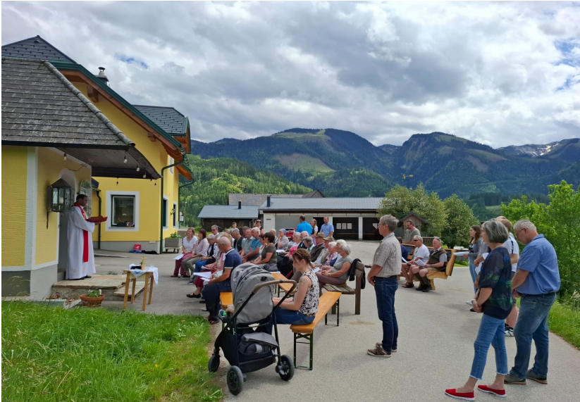
Antonibeten Bruneck am Pfingstsonntag.