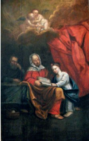
Altarpiece in der Kirche St. Jakob Ennetmoos.

Freitag, 26. Juli, 19.00 Uhr, St.-Anna-Kapelle