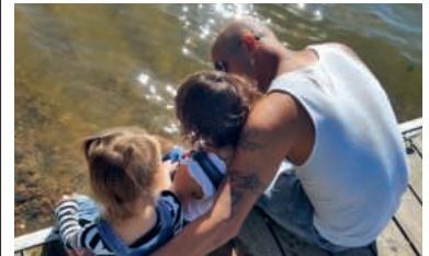
Die Ferienwoche verspricht Erholung für Alleinerziehende.

7.–10.8., Haus der Begegnung im Kloster Ilanz (GR) sowie umliegende Orte | Detailprogramm unter ilanzersommer.ch