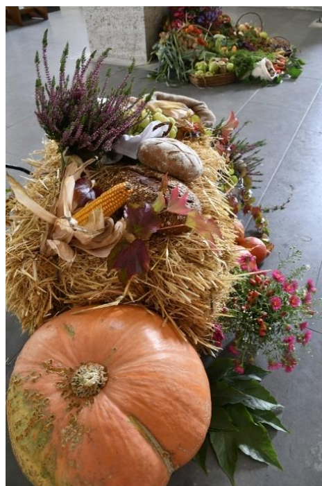
St. Marien Neuenbeken 2023

die in diesen Tagen die wunderschönen Erntedankaltäre in den Kirchen des Pastoralen Raumes gestalten!