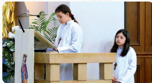
Parmi leurs tâches, depuis la gestion ecclésiale de l'épidémie de covid19 les servants d'autel assurent souvent la lecture de la prière universelle.

« Nous essayons de leur dire que leur seule présence pendant la célébration est tout à l'honneur du Seigneur, même s'ils ne font rien. La mission des servants d'autel est d'aider par la beauté, l'attitude de prière, le calme, le silence, les fidèles à entrer dans le mystère du Christ présent dans l'Eucharistie.