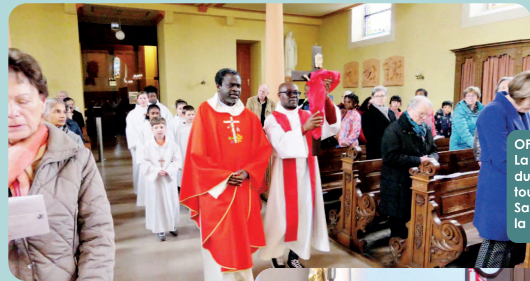
OFFICE DE LA PASSION La célébration de la Passion du Vendredi Saint ainsi que tous les offices de la Semaine Sainte ont été animés par la chorale Sainte-Cécile.