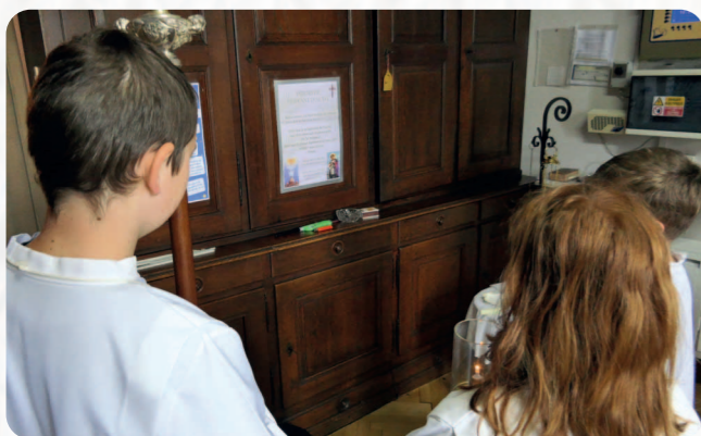
Avant chaque messe les servants d'autel prient pour se mettre en présence du Seigneur qu'ils vont servir au travers des différentes tâches qui leur sont confiées.

« Nous essayons de leur dire que leur seule présence pendant la célébration est tout à l'honneur du Seigneur, même s'ils ne font rien. La mission des servants d'autel est d'aider par la beauté, l'attitude de prière, le calme, le silence, les fidèles à entrer dans le mystère du Christ présent dans l'Eucharistie.