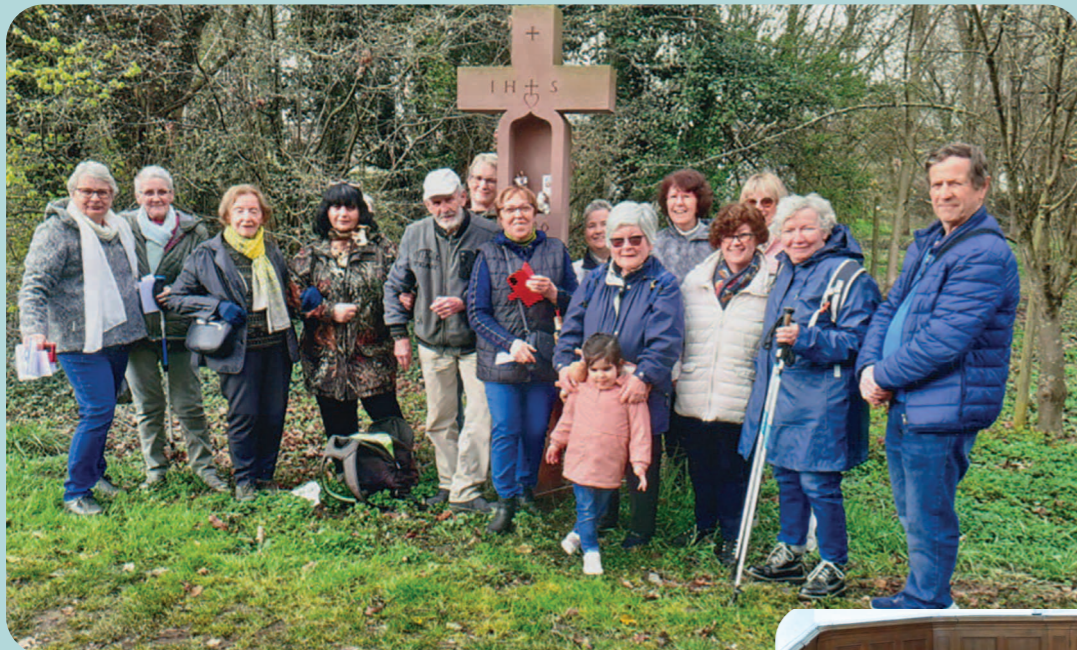
SAINT JOSEPH FÊTÉ Le jour de sa fête saint Joseph a été honoré par un bon groupe de pèlerins qui l'ont comme l'an dernier prié en marchant.