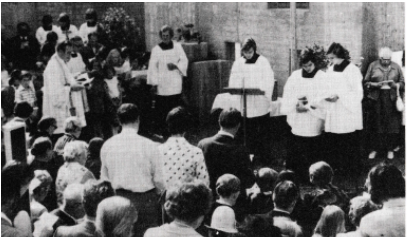
Der Grundstein wird gelegt – 19.7.1974

Herzlich willkommen zur Feier und herzlich willkommen im Gemeindezentrum.