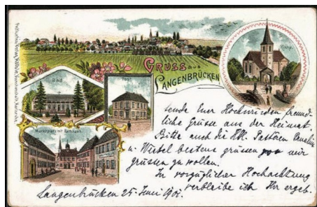
(Postkarte: Otto Meid)

am Samstag, den 13. Juli 2024, 15.00 Uhr im Pfarrheim St. Vitus Kirchstraße 3 in Langenbrücken wiederholt.