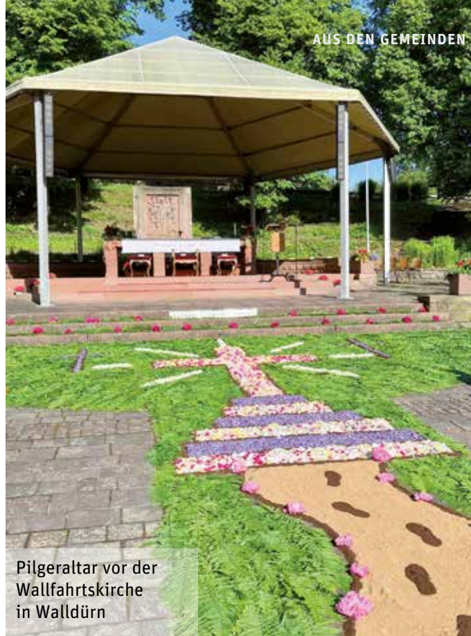
Pilgeraltar vor der Wallfahrtskirche in Walldürn

Wortgottesfeier mit Agape 3. Sonntag / Monat 10.30 Uhr, Kirche St. Vitus