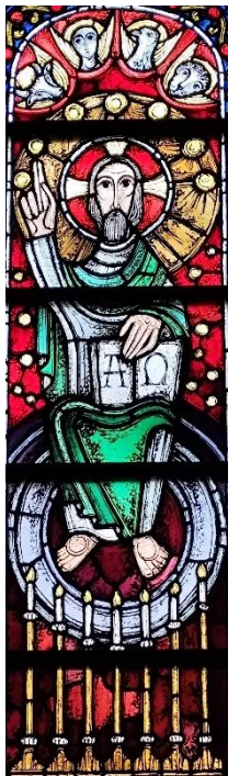
Christus-Farntextor: Chorfenster Pfarrkirche St. Lambertus, Castrop-Rauxel

Mögen alle Gläubigen in unserer neuen Pfarrei unter dem Schutz des Hl. Lambertus und mit seiner Fürsprache auch in Zukunft den Glauben überzeugend leben und im Blick auf Christus die Zeichen der Zeit deuten und entsprechend handeln.