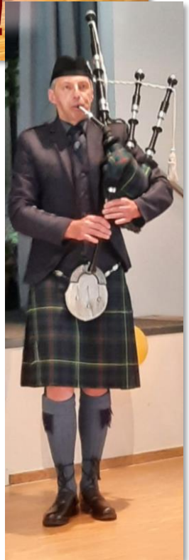
Ein besonderes Highlight - ein Dudelsackspieler.