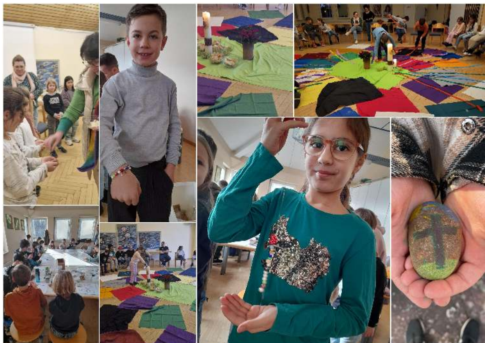
Impressionen der Erstkommunionvorbereitung 2025 in Steinheim.