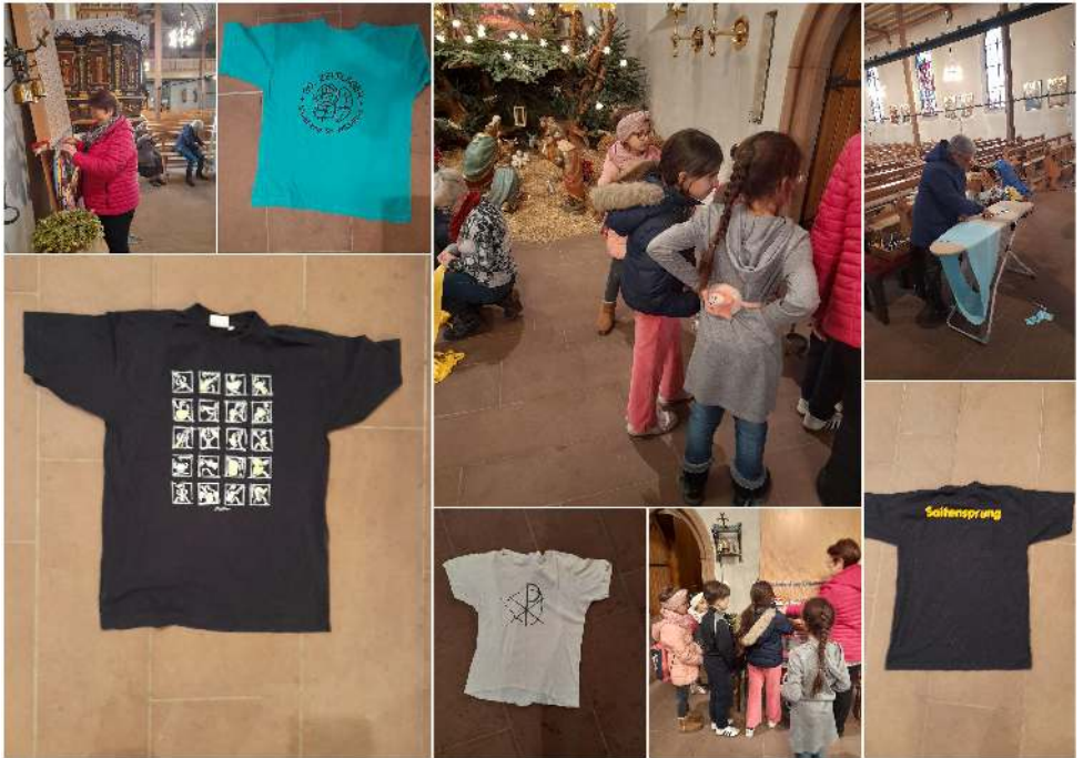
© Bilder: Inge Stöckel; Collage: G. Abrami