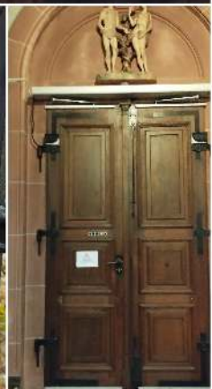
© Bilder: Hans Schwab; Collage: G. Abrami