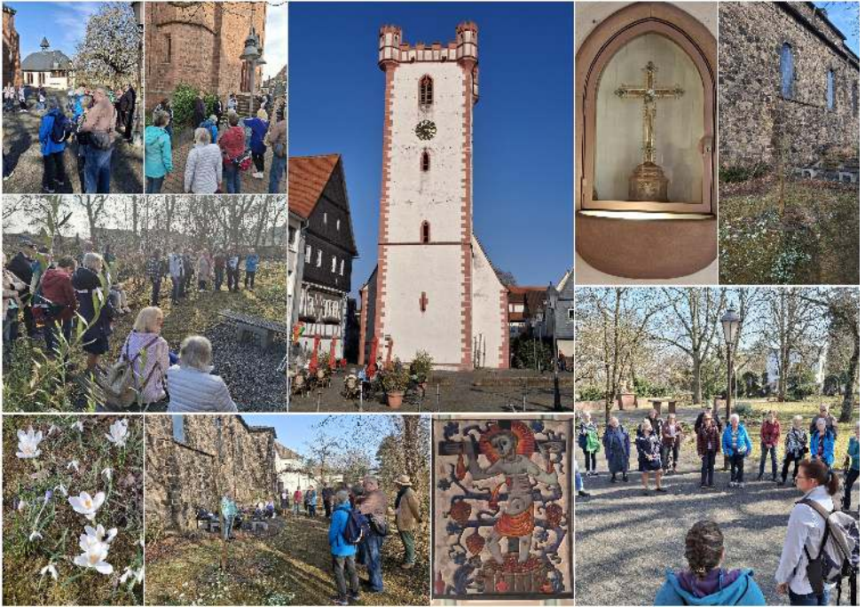
© Bilder: W. Schmidt; Collage: G. Abrami