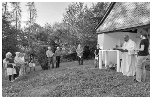
... und segnete die Krautwische und die Menschen, die gekommen waren.