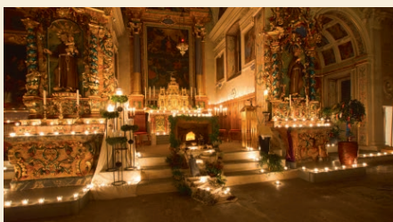
Rorate Sagogn 2018

Es ist ein besonderer Moment, frühmorgens, vor Sonnenaufgang, den Weg zur Kirche unter die Füße zu nehmen und diese ganz besondere Rorate-Liturgie zu feiern. Die Gemeinde wartet in der dunklen Kirche auf das Kommen des Lichts, auf Christus. Herzliche Einladung zu diesem äusserst besinnlichen Moment mitten im Advent. Nach dem Gottesdienst erwartet uns ein feines Frühstück in geselliger Runde.