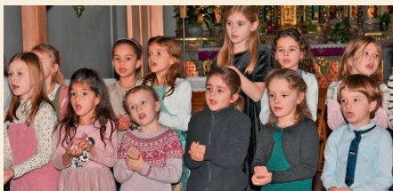
Offenes Adventssingen 2022