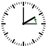
Umstellung Herbst Uhr wird zurückgestellt