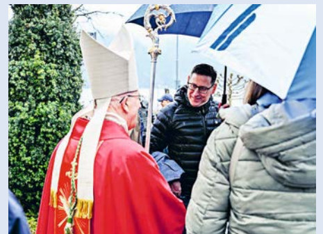
Gespräch mit dem Bischof.

Danach traten die Firmanden vor den Altar, entzündeten ihre Taufkerze und erneuerten ihr Taufversprechen. Anschliessend führten die Patinnen und Paten die Firmlinge vor den Altar und wurden vom Bischof mit heiligem Chrisam gefirmt. Ein besonderer Höhepunkt wa-