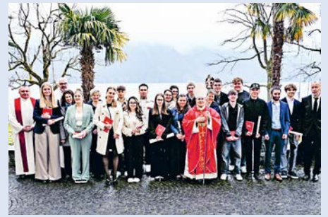
Firmlinge und Patinnen, Paten mit dem Bischof.

Wir hoffen, dass unser Vorschlag auf wohlwollende Zustimmung und Verständnis bei unseren Pfarrangehörigen und den Besuchern unserer Pfarrkirche trifft.