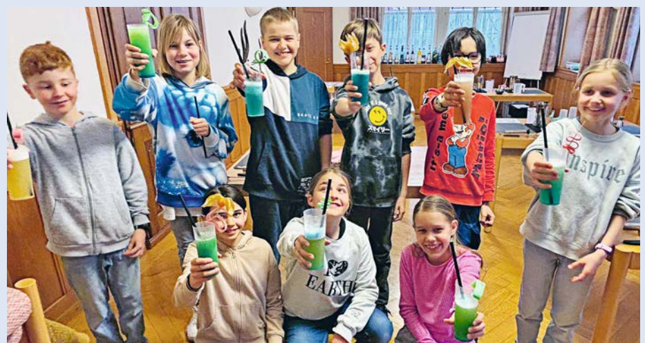
Abmessen – Shaken – Säfte gekonnt ins Glas leeren – Anstossen – probieren mhh ...