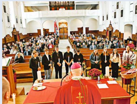
Erneuerung des Taufversprechens der Firmlinge

Nach dem festlichen Einzug mit der Marzellusfahne, dem Prozessionskreuz und den Fahndelegationen erlebten die Pfarreiangehörigen zusammen mit