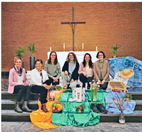
Der Vorstand der FG beim Gottesdienst der Generalversammlung 2025 zum Thema «genussvoll unterwegs».

Weitere Daten: 17. Juni, 2. Sept., 27. Januar.