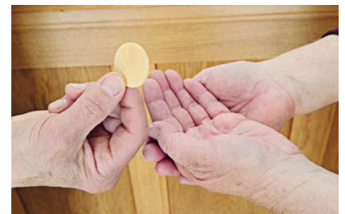
Austeilung der hl. Kommunion im Spital Schwyz.

Eugen Koller / Spitalseelsorge; Bild: zVg