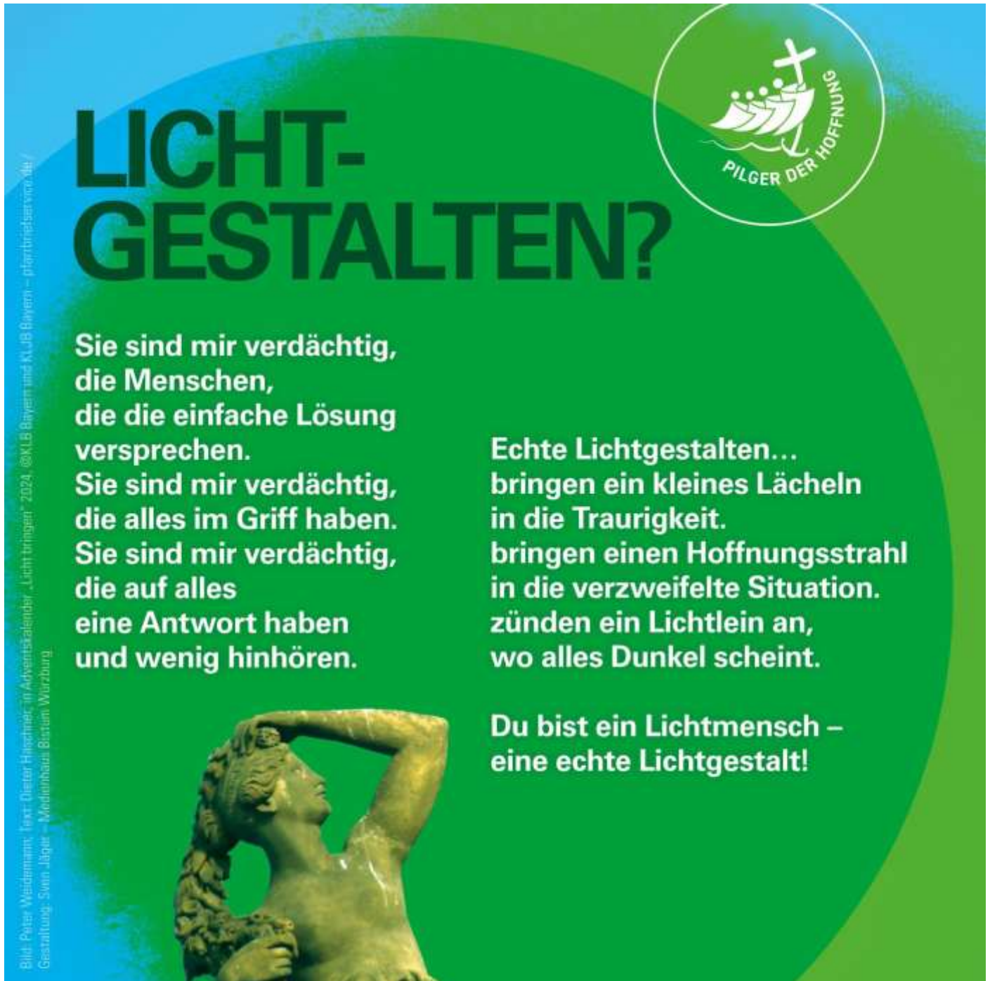
Text: Dieter Haschner, in Adventskalender „Licht bringen“ 2024, @KLB Bayern und KLJB Bayern, Layout: Sven Jäger - Medienhaus Bistum Würzburg