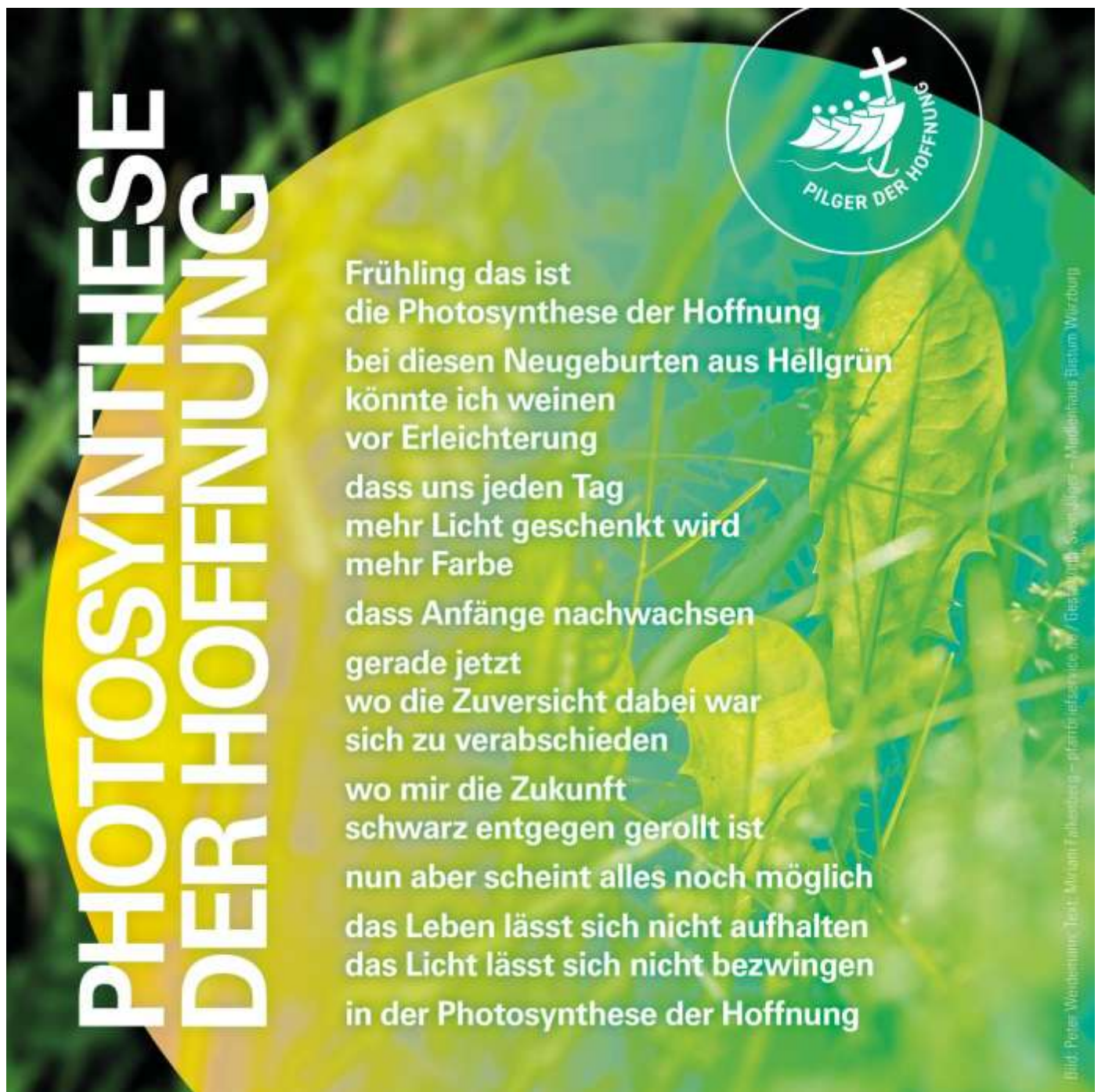
Text: Miriam Falkenberg, Layout: Sven Jäger - Medienhaus Bistum Würzburg