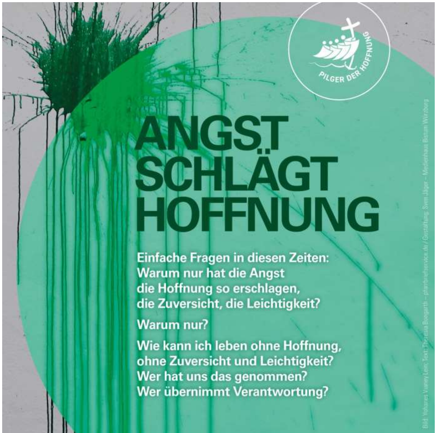
Text: Theresia Bongarth, Layout: Sven Jäger - Medienhaus Bistum Würzburg

17:00 Pr Feier vom Leiden und Sterben Christi