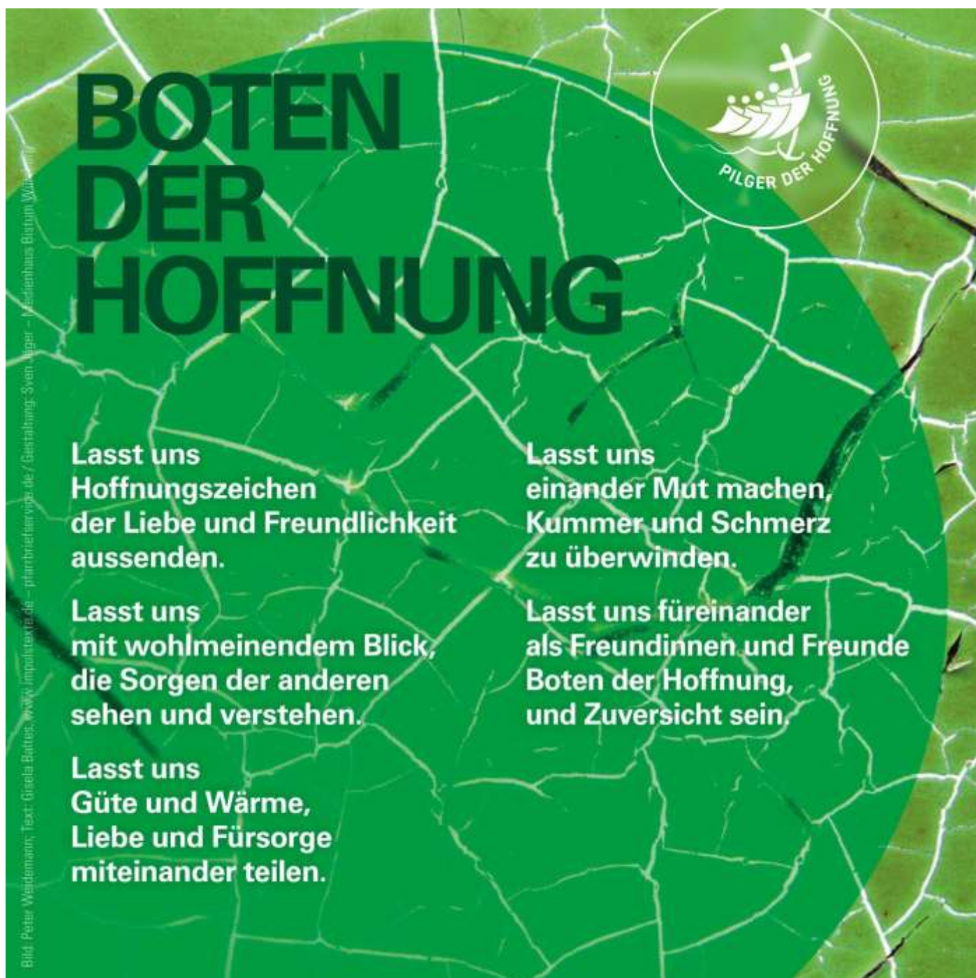
Text: Gisela Baltes, www.impulstexte.de , Layout: Sven Jäger - Medienhaus Bistum Würzburg

19:00 Pr Hl. Messe vom letzten Abendmahl