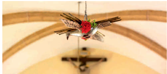
Der Heilige Geist in Form einer Taube bei der Pfingstmesse.