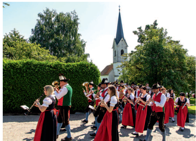
Kirchtagsstimmung in Treffelsdorf. Patrozinium der Hl. Margaretha mit Umgang und Kirchtag im Gasthaus Kaiser .