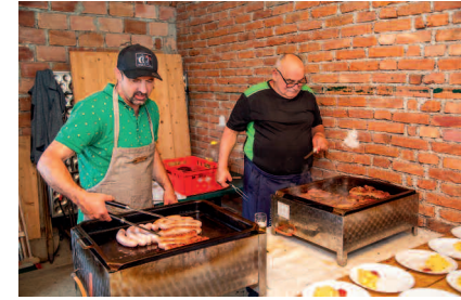
Am Christi Himmelfahrtstag fand in der Pfarrkirche Steinbichl wieder das bekannte “Engelaufziehen” statt. Nach der Festmesse fanden sich die Gläubigen beim anschließenden Pfarrfest ein. Bei köstlichen Speisen und Musik ging der Festtag fröhlich zu Ende. Herzlichen Dank an alle Pfarrfestmitarbeiter!