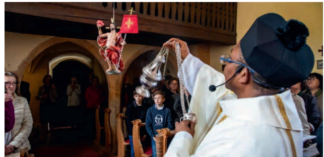
Festmesse und Engelaufziehen zu Christi Himmelfahrt.