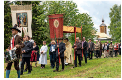
Dreifaltigkeitssonntag: Heilige Messe und Prozession in Dreifaltigkeit am Gray. Prozession durch den Wald mit der Glantaler Blasmusik Frauenstein zu den vier Evangelienstationen. Anschließend Kirchtag beim Jägerwirt .