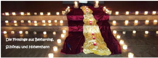
Die Firmlinge aus Beyharding, Schönau und Hohenthann