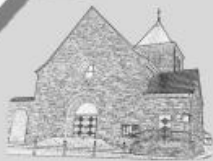
St. Matthäus, Kriegsfeld