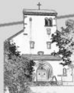
Mariä Geburt, Bolanden