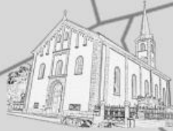
St. Peter, Kirchheimbolanden