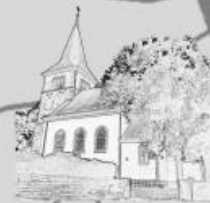
Leib Christi, Stetten