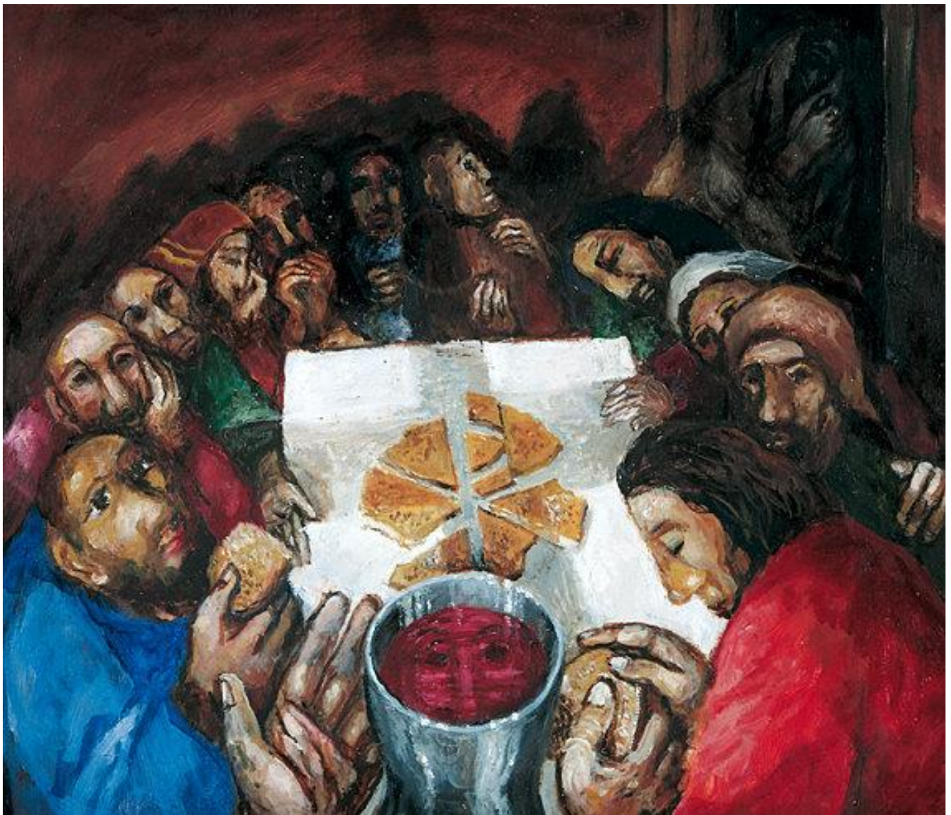
Bild: Sieger Köder: Das letzte Abendmahl, in: Durchkreuztes Leben, Schwabenverlag