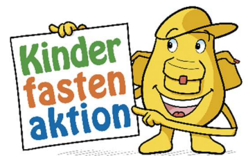
Logo: Kinderfastenaktion, MISEREOR

...für das Fastenopfer der Kinder liegen in der Kirche in Sand und im Pfarrbüro zum Mitnehmen bereit.