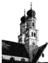
Mariä Himmelfahrt Niederschönenfeld