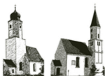
St. Jakobus – St. Georg Unterpeiching Mittelstetten