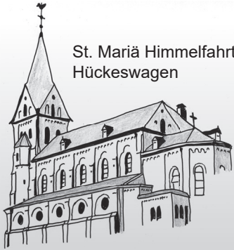
St. Mariä Himmelfahrt Hückeswagen