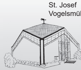
St. Josef Vogelsmühle