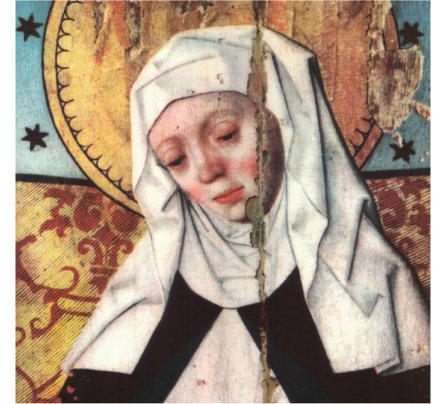
Altartafel, Kirche von Salem

Birgitta von Schweden (geb. um 1303) war erst 10, als sie erste Visionen erlebte – eine Begabung, die sie durch das Leben begleitete. Früh wurde sie Mutter von acht Kindern; mit ihrem Mann verband sie eine tiefe Frömmigkeit. Gemeinsam unternahmten sie große Wallfahrten. Danach lebten beide in klösterlicher Abgeschiedenheit. Ihr Mann starb 1344, Birgitta wurde durch Visionen „Braut und Sprachrohr Christi“. So kam es zur Gründung einer Klostersgemeinschaft – „Erlöserorden“ genannt. 70-jährig starb sie 1373 in Rom. Ihr Gedenktag ist der 23. Juli.