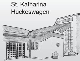
St. Katharina Hückeswagen