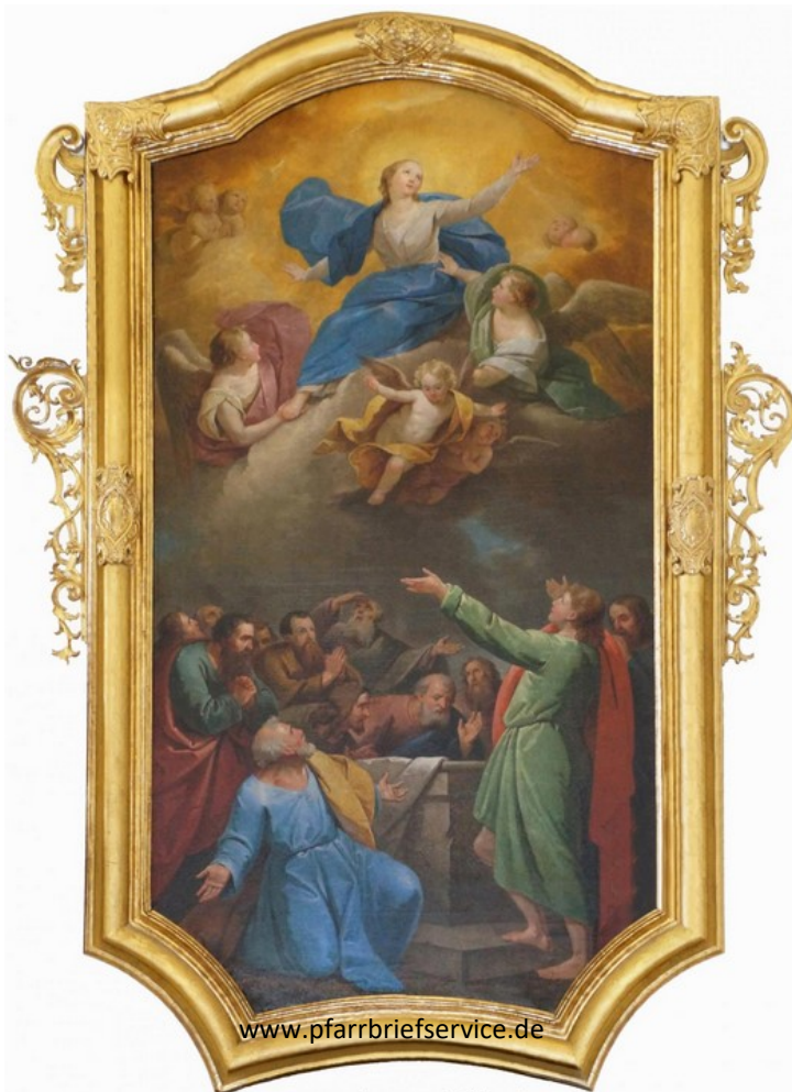
maria himmelfahrt aufnahme mariens in den himmel von „paul troger“ seitenaltarbild in der pfarrkirche peuerbach o.ö. mm

10.00 St. Petrus C. russisch-orthodoxer Gottesdienst