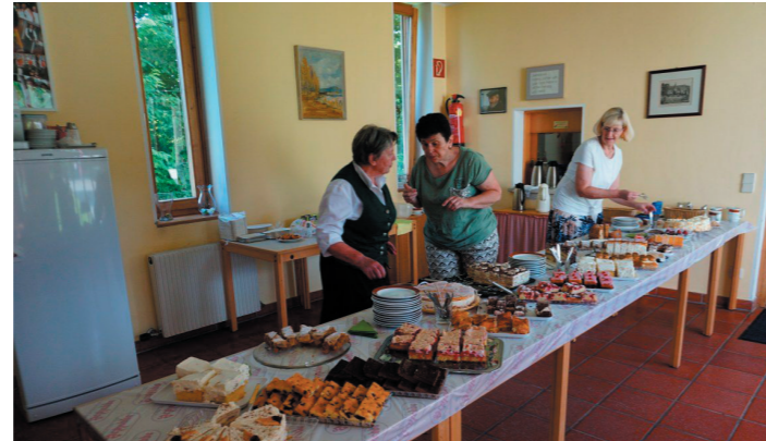
Vorraum mit Küche