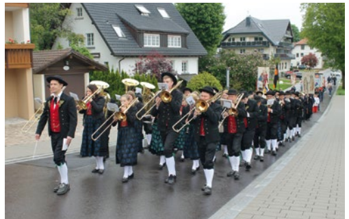
Bilder und Text: Cornelia Liebwein