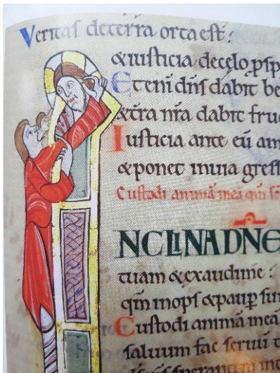
Foto: Darstellung aus dem Stuttgarter Psalter, Ps 86 „Neige dein Ohr, Herr“

Das Buch der Psalmen zählt zu den besonderen Texten des Alten Testaments. Die Gebets- und Glaubensgeschichte Israels kommt darin zum Ausdruck. Die Menschen haben in diese Zeilen all das gelegt, was sie mit Dank und Freude, in Hoffnung und Sehnsucht aber auch in Not, Leid und Trauer vor Gott aussprechen, ja manches Mal auch hinausschreien wollten. Die Psalmen werden ebenso zu Lob und Dank und zur Ehre Gottes angestimmt.