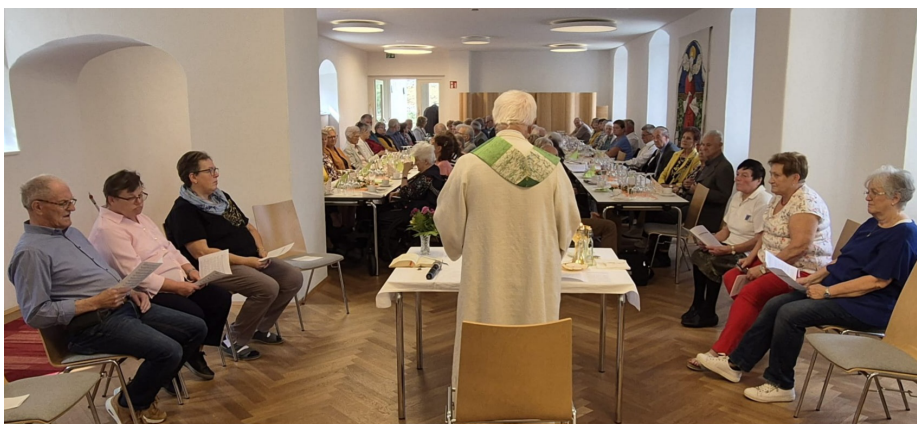
Hl. Messe bei der Geburtstagsfeier der Senioren im September 2024

Eine gute Gelegenheit, mit Menschen in unseren Pfarren ins Gespräch zu kommen, sind auch die Geburtstagsbesuche und -gratulationen zuhause, die ab dem 70. Lebensjahr von den Pfarrgemeinderäten überbracht werden. Ein herzliches Dankeschön auch für diesen Dienst.