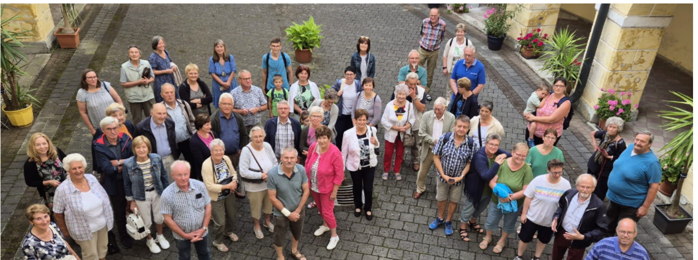
Bild 1: Bittgang der Zogelsdorfer zur Barbarakapelle, Bild 2: Wallfahrt der Gauderndorfer nach Maria im Gebirge Bild 3 und 4: Pfarrgemeinschaftswallfahrt nach Maria Puchheim/OÖ