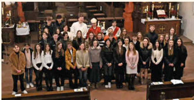
Bischof Franz mit den Firmlingen aus Güntersleben, Thüngersheim und Rimpar.