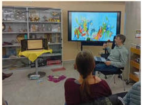
Vorstellung des Kamishibais

Zudem wurden die vielfältigen Materialien, Bücher und Zeitschriften vorgestellt, die im RMZ ausgeliehen werden können. Anschließend hatten die Teilnehmerinnen Gelegenheit, zu stöbern, Fragen zu stellen und neue Ideen zu sammeln. Ein gemeinsames Gebet rundete den Abend ab. Übereinstimmend waren die Teilnehmerinnen der Meinung, dass es eine bereichernde Gelegenheit war, wertvolle Impulse zu erhalten und sich mit anderen Engagierten auszutauschen.