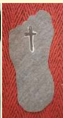
Fußspur Seite 7