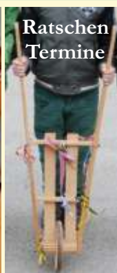
Ratschen Termine Osterratschen Seite 5