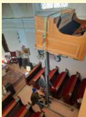
Orgel für Seyring Seite 3