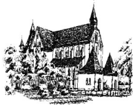
St. Antonius (A) Tiefentalstr.