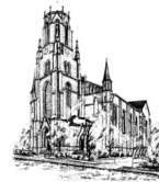
Herz Jesu (H) Danzierstr.