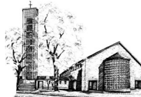
St. Elisabeth (EI) Elisabeth-Breuer-Str.