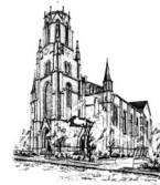
Herz Jesu (H) Danzierstr.