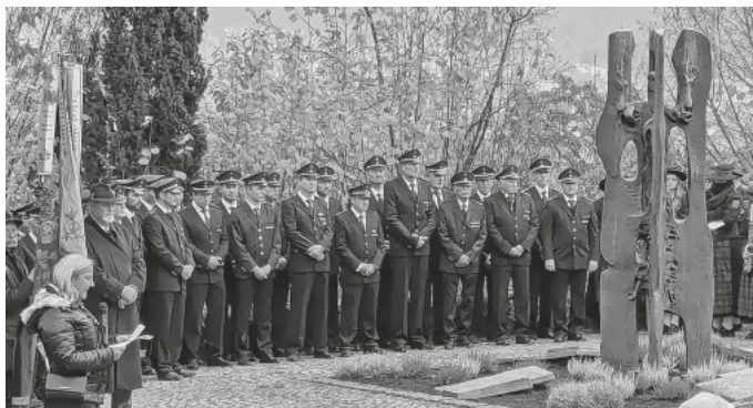
Gedenkveranstaltung zum Volkstrauertag

Am Denkmal der Weltkriege auf dem Friedhof wurde zur Erinnerung der gefallenen Soldaten ein Kranz niedergelegt.