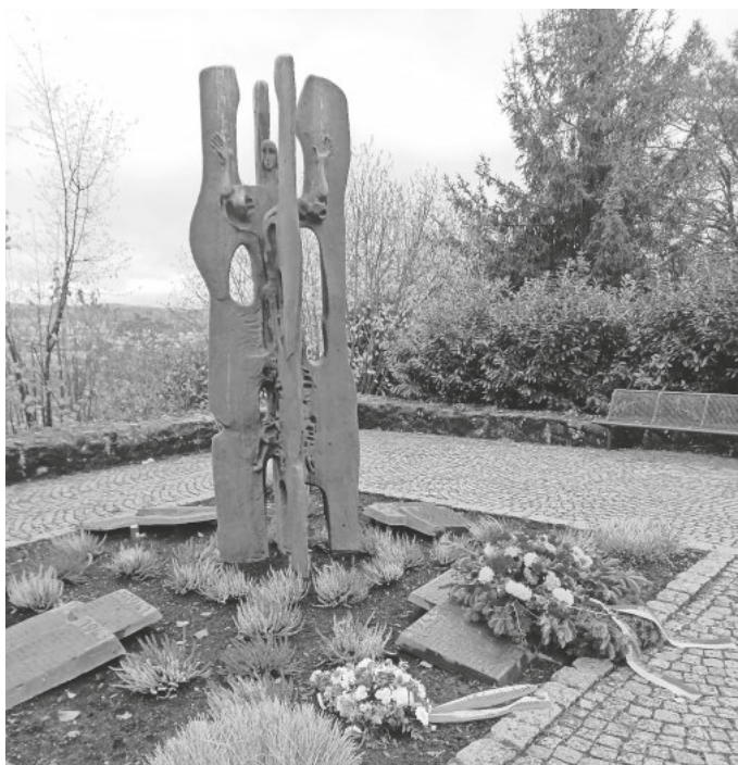
Kranz am Kriegerdenkmal auf dem Friedhof in Berg