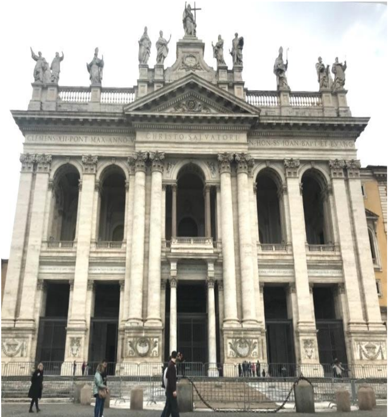
Lateranbasilika zu Roum