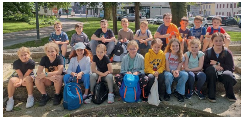
Erstkommunionkinder aus Deitingen und Subingen

Wir wünschen den Kindern und ihren Katechetinnen einen guten Start sowie viele bereichernde Momente fürs neue Schuljahr.