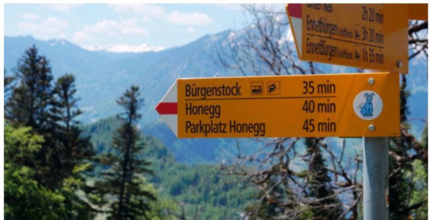
Vertreter aus 92 Ländern und acht internationale Delegationen nehmen an der Ukraine-Konferenz auf dem Bürgenstock teil.