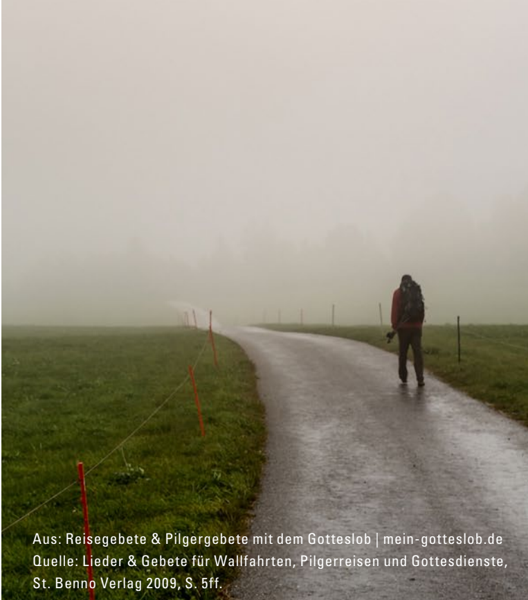
Aus: Reisegebete & Pilgergebete mit dem Gotteslob | mein-gotteslob.de Quelle: Lieder & Gebete für Wallfahrten, Pilgerreisen und Gottesdienste, St. Benno Verlag 2009, S. 5ff.

O Gott, du hast Abraham aus seinem Land herausgeführt und ihn auf allen seinen Wegen behütet. Gewähre auch uns diesen Schutz. Stärke uns in Gefahr, behüte unseren Schritt. Sei uns ein kühler Schatten in der Hitze des Tages, schützender Mantel gegen die Kälte. Trag uns in Ermüdung, und verteidige uns in jeder Not. Sei uns ein fester Stab gegen den Sturz und ein Hafen, der die Schiffbrüchigen aufnimmt. Lass uns unter deiner Führung mit Sicherheit unser Ziel erreichen. Lass uns unsere Heimat finden, lass uns ankommen bei dir.