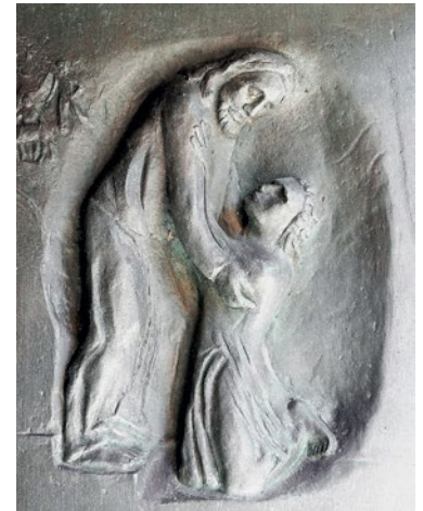
Bild: Friedbert Simon (Fotografie), Roland Friederichsen (Künstler). In: Pfarrbriefservice.de

Die Beichte ist wie alle anderen Sakramente ein Geschenk, durch das Gott uns seine erlösende Liebe und Barmherzigkeit real und gegenwärtig gemacht hat. In seinem Wunsch, alle Menschen zu befreien und sie in den echten Frieden, der die Gemeinschaft mit Gott ist, hineinzuziehen, hat Christus sein Amt der Versöhnung den Aposteln anvertraut. Indem wir einem Priester beichten, werden wir nicht nur mit Christus versöhnt, sondern auch mit der Gemeinschaft der Kirche. Oft vergleichen wir unsere Beziehung zur Kirche mit der Mitgliedschaft in einem Verein oder unserer politischen Zugehörigkeit. Aber das ist nicht der Fall. Unsere Beziehung zur Kirche ist persönlich und intim, und wie jede ehrliche Beziehung erfordert sie Vergebung und Heilung. Der Priester vertritt sowohl Christus als auch die Kirche, die der Leib Christi ist. Und