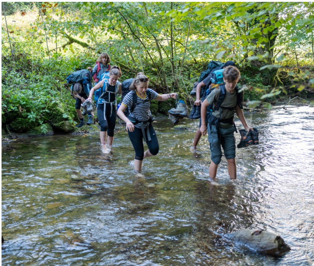
Schülerinnen und Schüler der Kantonsschule Solothurn durchqueren während einer Projektwoche «Pilgern auf dem Jakobsweg» die Lützel.

gang. Hier trafen sich viele Pilgerinnen und Pilger, um gen Santiago weiterzuziehen. Mit Schüler/innen-Gruppen habe ich schon häufiger während einer Spezialwoche den Weg von Basel nach Solothurn unter die Füsse genommen.