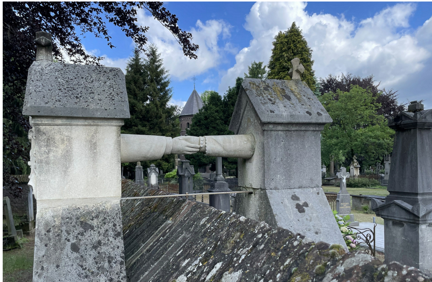
Grabstätten Jakobus van Gorkum und Josephina van Aefferden

- siehe auch Innenseite - Foto: Karl-Heinz Schumacher