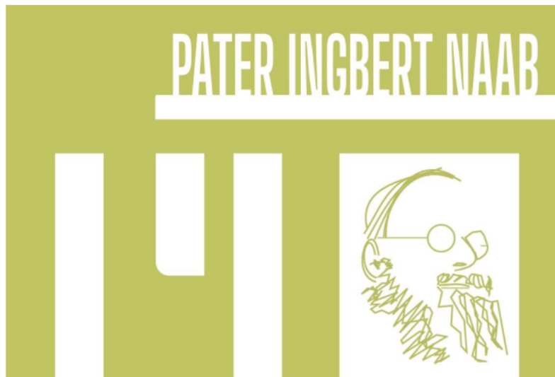
Logo: Johannes Dockweiler, OWG Dahn