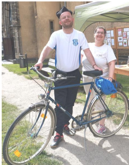
Poutní maraton 2024 aneb Maratonů je spousta, ale POUTNÍ je jen jeden | Donio eko

Mimochodem ještě do 7. 7. 2024 můžete na činnost Hospice Sv. Jiří přispět i přes odkaz: